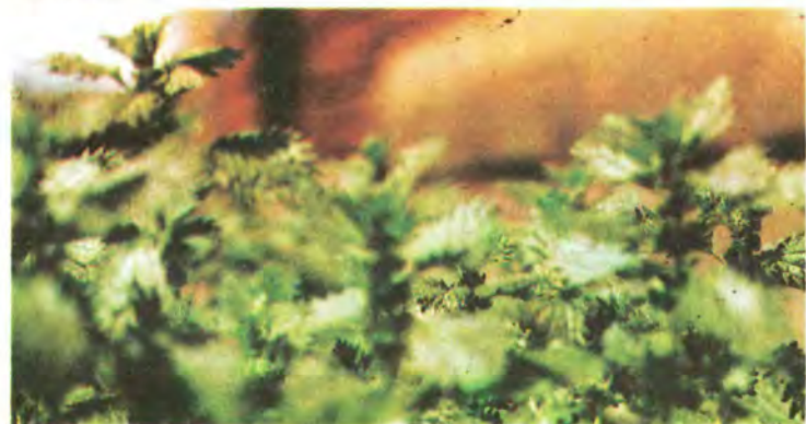
1061. Кропива жалка.